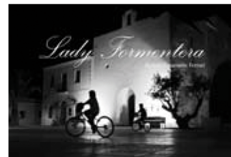
Lady Formentera , di Stefano Emanuele Ferrari, Tg Book 2010, 192 pagine, 42 euro.

Circa 130 foto. Sono quelle scelte e pubblicate da Stefano Emanuele Ferrari tra le quasi 5mila scattate in 5 mesi di soggiorno a Formentera. Un soggiorno fatto di lunghi appostamenti per catturare un'emozione: le rughe del mare, un'alba, il muro di una casa, un mercatino hippy improvvisato sulla strada ( sopra ), bambini che giocano in una piazzetta di notte. In queste foto si coglie il desiderio d'indagare la natura, di ritrarre gli abitanti e i turisti nei loro riti. Formentera è un'isola a colori, tinte forti del mare e della terra, ma l'autore ha scelto il bianco e nero per meglio trasmettere la poesia dell'isola e il suo fascino misterioso. Missione compiuta.