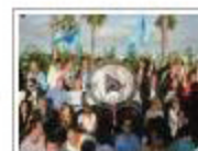
Mitin de Rajoy en Palma